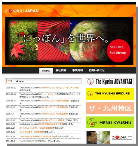
ZIPABGU JAPAN ホームページ

このコンシェルジュ方式の旅行相談を6月にオープンした外国人英語サイトで既に開始しており、今回のジパングジャパンが行っている企業紹介先への訪日旅行や、それに付随する観光などの手配をウェブトラベルで行うものです。特に焼酎は徐々に世界に知れはじめており、ジパングジャパンのサイトから焼酎メーカーへのアプローチなども徐々に増えるものと予測しております。両社はジパングジャパンが発信する「The Kyushu ADVANTAGE」で紹介する企業への訪問や視察旅行、また観光客にも紹介出来る九州を英語サイトで旅行相談に応じ、訪日客にきめ細かな旅行サービスを目指しております。