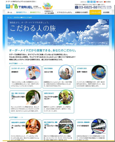
ウェブトラベルのホームページ